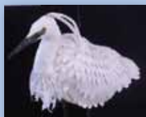
2月展示：多摩川に来る野鳥展(登戸の冬鳥)