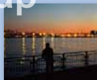
3月展示：川崎の工場夜景写真展